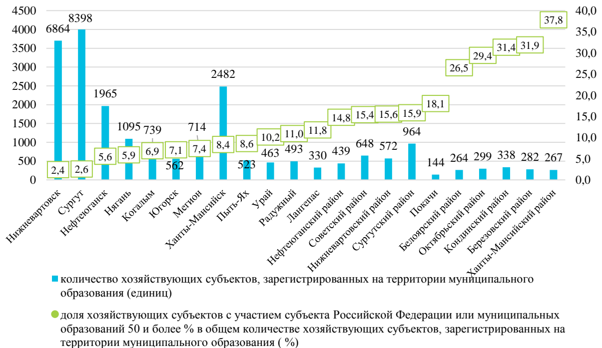
Диаграмма 3 – Доля хозяйствующих субъектов с участием субъекта Российской Федерации или муниципальных образований 50 и более процентов в общем количестве хозяйствующих субъектов зарегистрированных на территории муниципального образования в разрезе