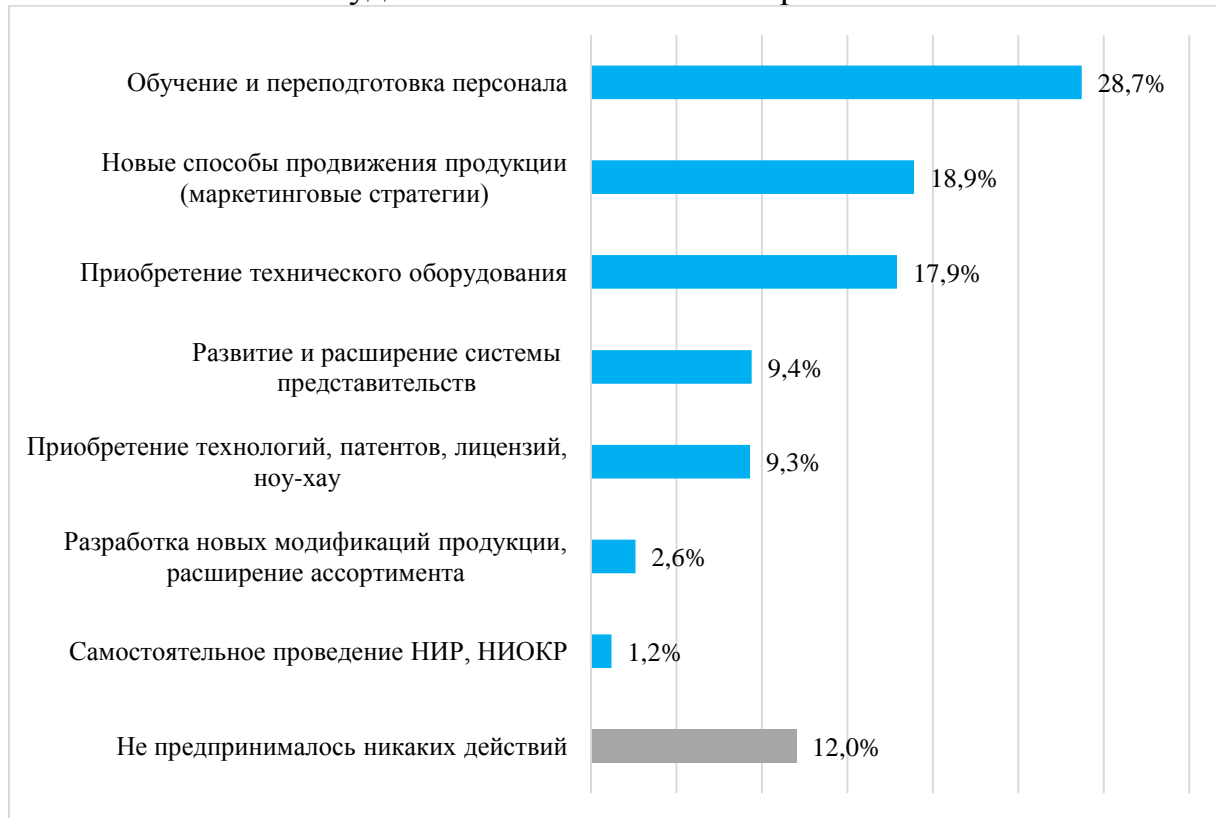
Диаграмма 1 – Распределение ответов субъектов предпринимательской деятельности на вопрос анкеты «Укажите, какие меры по повышению конкурентоспособности продукции, работ, услуг, которые производит или предоставляет Ваш бизнес, Вы предпринимали за последние 3 года», в% удельного веса от числа опрошенных

Из условий, необходимых для признания благоприятным состояния и (или) динамики конкурентной среды 23 , в автономном округе отмечен рост количества конкурентов (не аффилированных с предыдущими) на рынках на 1 и более субъект предпринимательской деятельности в течение трех лет.